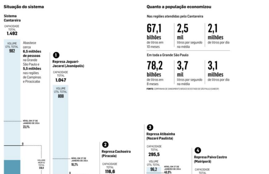
Figura 3. O sistema (Passado e Futuro do Cantareira)

O único vídeo presente, com pouco mais de três minutos, mostra cidadãos, não identificados em créditos, respondendo a pergunta colocada “Vai acabar a água?”. Ao lado, algumas das declarações são reproduzidas textualmente e devidamente creditadas. Existe aqui o interesse em mostrar as opiniões diferentes de pessoas comuns sobre um assunto que as afeta diretamente.